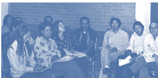
Maestros en curso de capacitación, 1975.