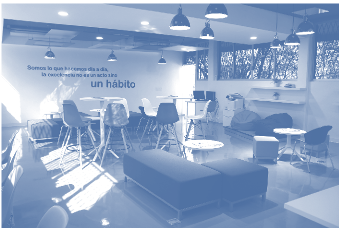
The Co-worker Center, Facultad de Salud Pública y Nutrición, UANL.