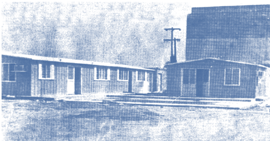
La antigua Escuela de Salud Pública