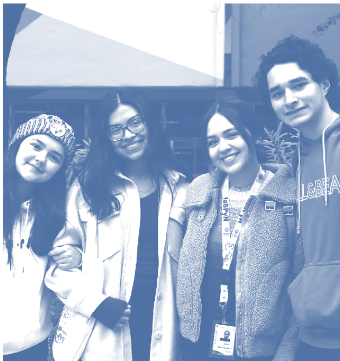
Estudiantes de la Facultad de Salud Pública y Nutrición, UANL.