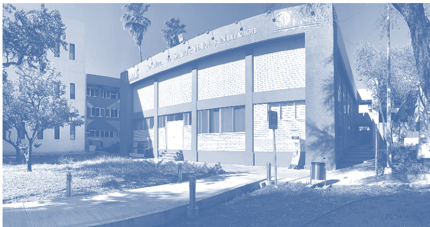
Facultad de Salud Pública y Nutrición