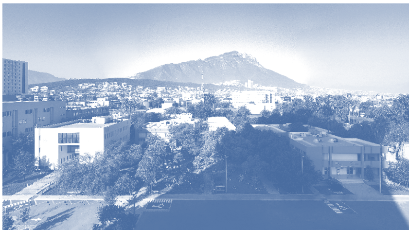
Facultad de Salud Pública y Nutrición