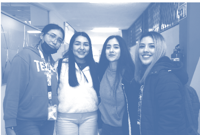
Estudiantes de la Facultad de Salud Pública y Nutrición, UANL.