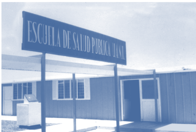
Escuela de Salud Pública