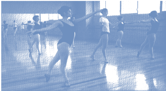
Práctica de danza clásica