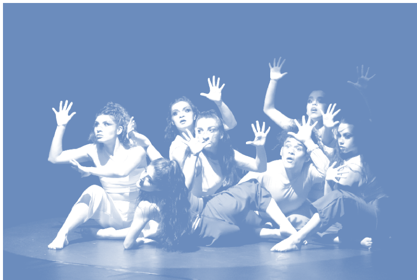
Gala de danza