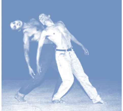
Ejecución de danza contemporánea