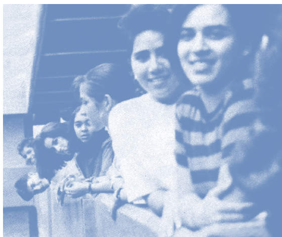
Estudiantes durante un receso