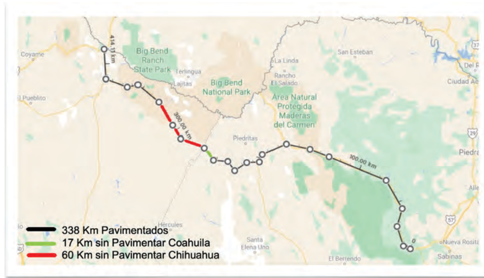
Imagen 4: La Nueva Carretera Múzquiz a Ojinaga tendrá 415 km, de los cuales aún faltan 77 km.